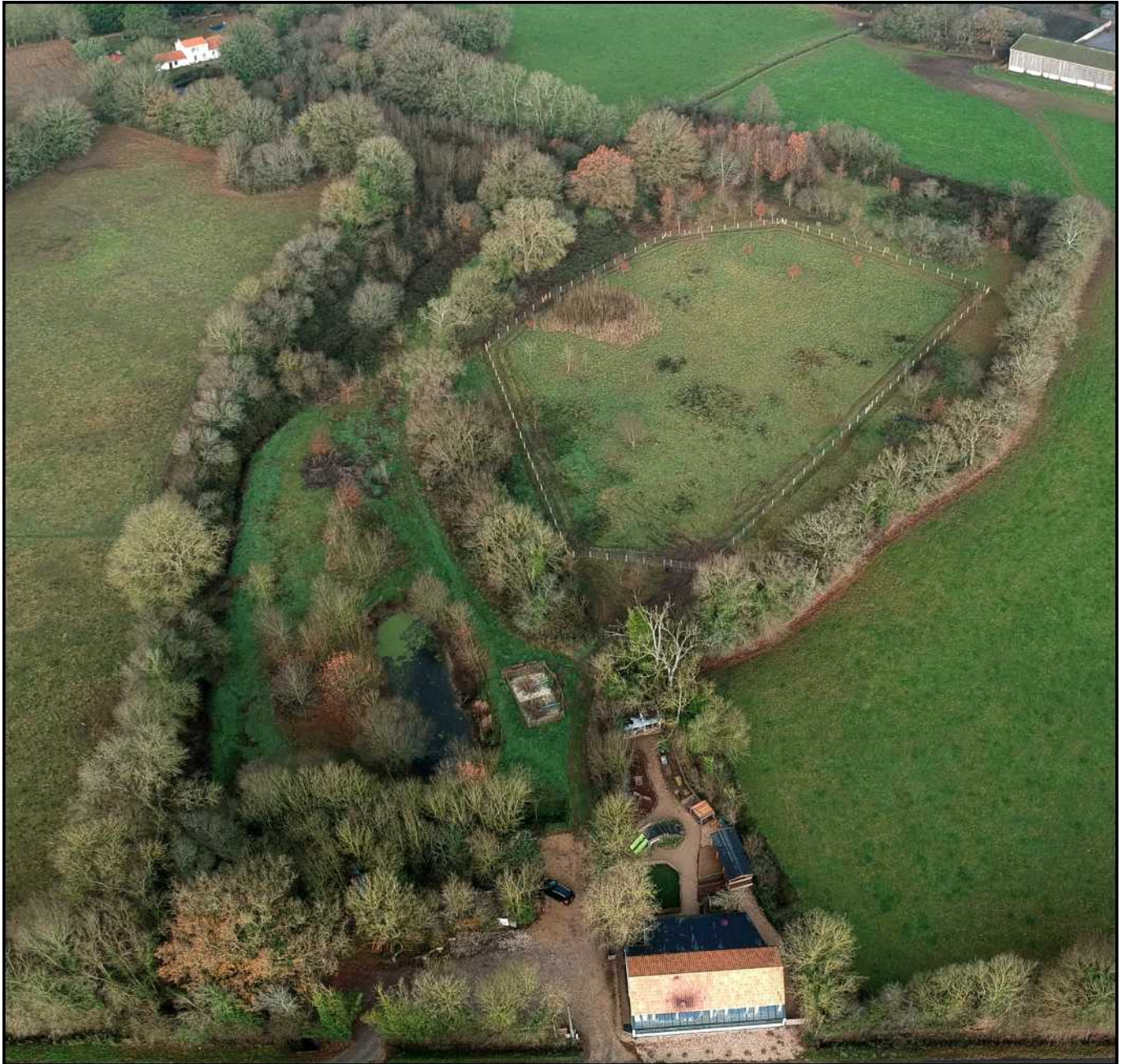
Vue aérienne de l'école 1, 2, 3 Colibris et du parc, à l'automne.

L' école 1, 2, 3 Colibris se situe en Vendée, plus précisément à Apremont (85220). Elle borde un terrain de presque trois hectares ; avec une mare, des haies bocagères, un bois de chênes, des frênes, aulnes, ormes et autres espèces de feuillus ; un verger ainsi qu'un potager biologique. Aucun produit phytosanitaire (insecticide, pesticides, etc.) n'est utilisé sur le site.