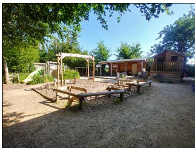
La cour « 100 % sans bitume »